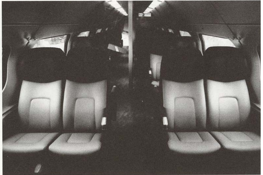
Treinstoel Regiorunner (interieurfoto): NS Design